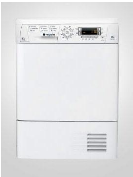
Sèche-linge à évacuation ou à condensation